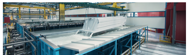
KTL: Proteção contra corrosão em chassi e caixa por cataforese