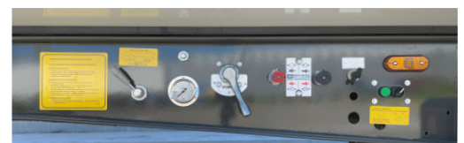
Suspensão de três posições e ajuda à tração