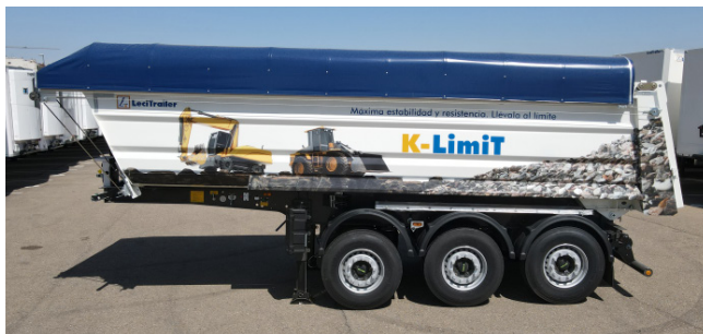
Desenho compacto, excelente manobrabilidade