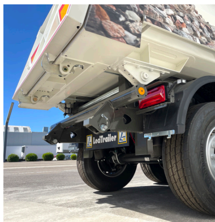
Pára-choques dobrável e protetores para asfalto