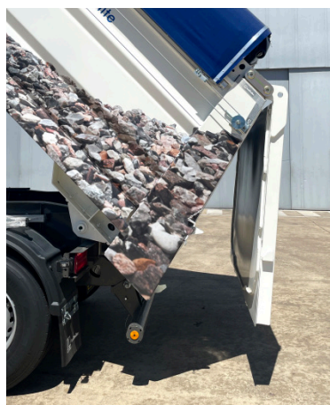
Porta de abertura vertical de duplo giro